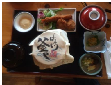
昼食：はまぐり釜飯