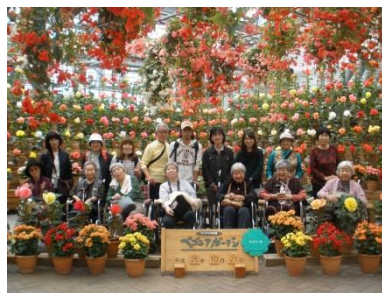
ベゴニアガーデン