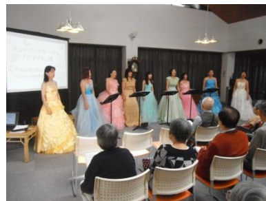
ミュージックサークル・スマイル 様