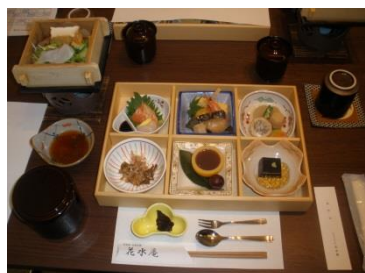
和順会館「菊水亭」の昼食