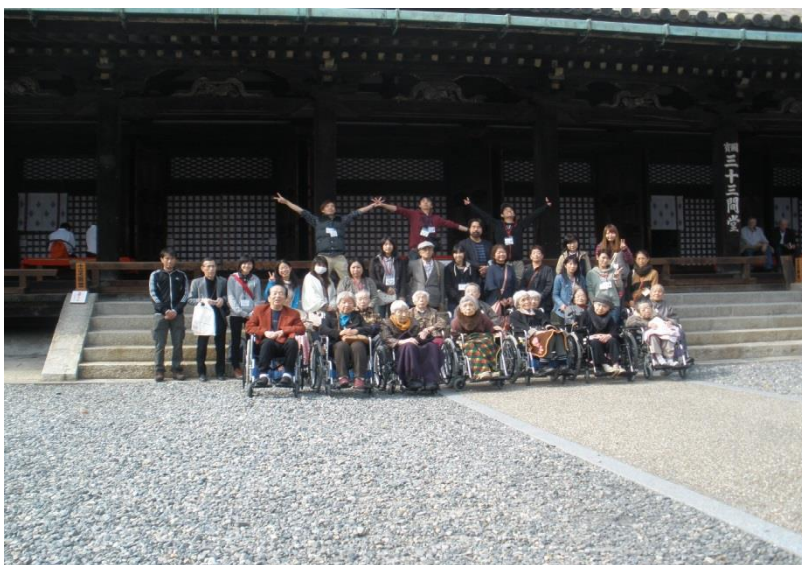
三十三間堂境内で記念撮影

今年の日帰り旅行は「秋の京都・三十三間堂と錦秋御膳」とさせていただきました。東山にある名跡三十三間堂は身近にありながらあまり訪れることが御座いませんでした。正式名称は「蓮華王院三十三間堂」と言い毎年一月に行なわれる「通し矢」と国宝の「千手観音坐像」と重文の「千体千手観音立像」で有名です。昼食は知恩院の境内にあります「和順会館」で京料理を召し上がっていただき、京土産をたくさん買って秋の一日を楽しめました。