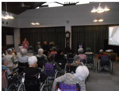
E.T と唄おう会 様

今回は入居者様と一緒に「にほひ袋」を作っていただきました。色々なハーブを使って小さな布袋に詰めて頂き、初めての体験に「たいへん可愛い」と喜んでいただきました。特に女性の入居者様には大好評でした。