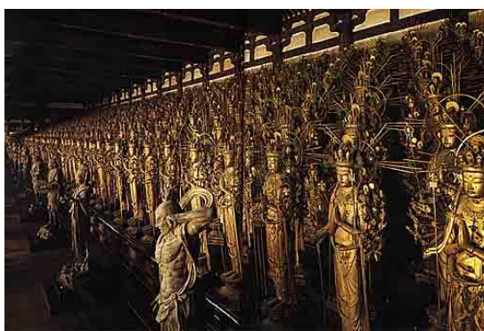
千体千手観音立像