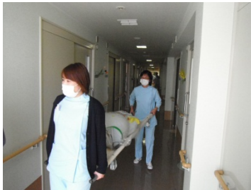
消防・避難訓練の様子

大津消防署職員による「救急救命講習」を開催いたしました。毎年消防署職員指導のもと緊急時の救命措置の訓練を行っております。