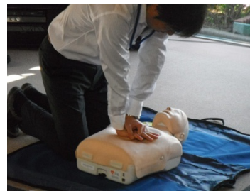
救命救急講習の様子