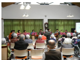
「ラーゴ・マンドリン・アンサンブル」様

「ラック栗東」の皆様によるフラダンス。 入居者様も手の動きを真似て一緒にたのしまれ、一足早い南国気分を味わっておられました。