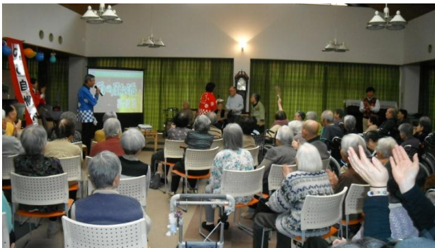
「コンサルテ瀬田・のど自慢大会」会場風景

3月18日(日)「コンサルテ瀬田・のど自慢大会」を開催いたしました。歌の大好きな入居者様多数にまじって歌自慢の職員も一体となり大いに盛り上がり参加された入居者様も当日までに練習された成果を出され本当に楽しい一日を過ごされました。