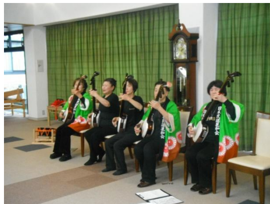
「日本民謡晃和会」様の演奏