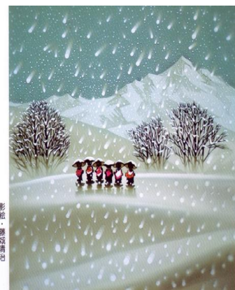
日本昔話「笠じぞう」より