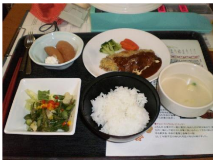
ビーフカツレツ温野菜添、グリーンサラダ チャウダー、ご飯、デザート