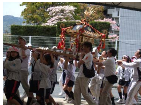
[カルテットEです]様