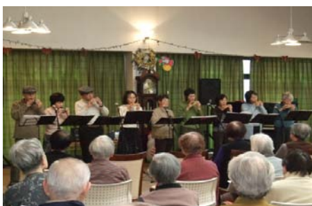
「ベストフレンド」様のオカリナ演奏

12月28日は年末恒例の「コンサルテ瀬田餅つき大会」が開催されました。よいしょ、よいしょの元気な掛け声とともに沢山のお餅がつきあがり、そのあとは「餅花」作りを楽しみました。当日のおやつは「ぜんざい」を召し上がっていただきました。