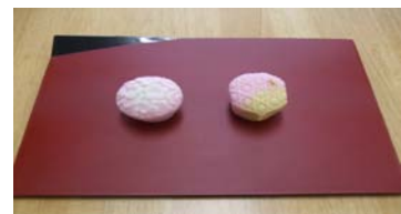
和菓子：元旦・亀、二日・寒梅