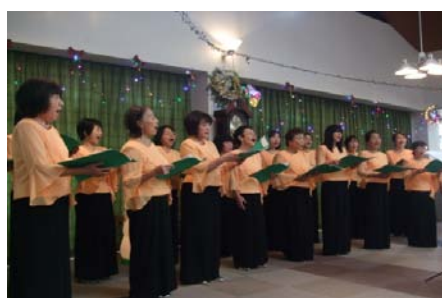
女声合唱団「コール平野」様