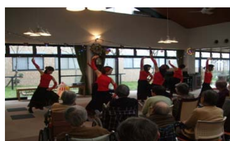
「コンサルテ瀬田クリスマス会」