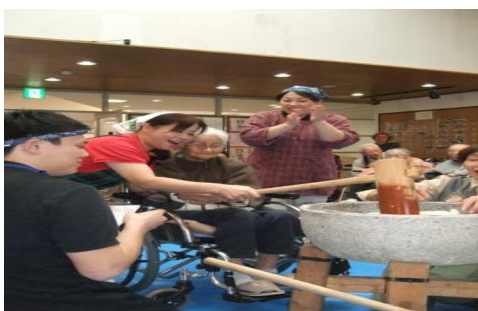
「お餅つき」と入居者様がつくられた「餅花」