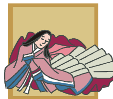
百人一首大会 (1月9日)