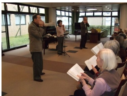
草津ハーモニカクラブ様

今回で、九回目の来館ですが、いつもリクエストした曲を演奏され、聴衆は大きい声で合唱です。「あざみの歌」「早春賦」「荒城の月」「琵琶湖周航の歌」などジャンルは豊富です。