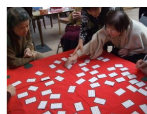
とっても盛り上がりました！