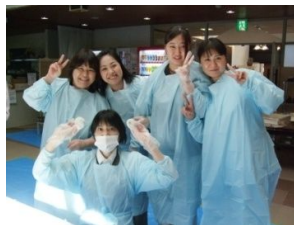
お餅つきのスタッフ