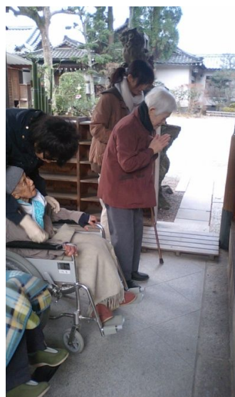
2日、3日 建部大社に初詣