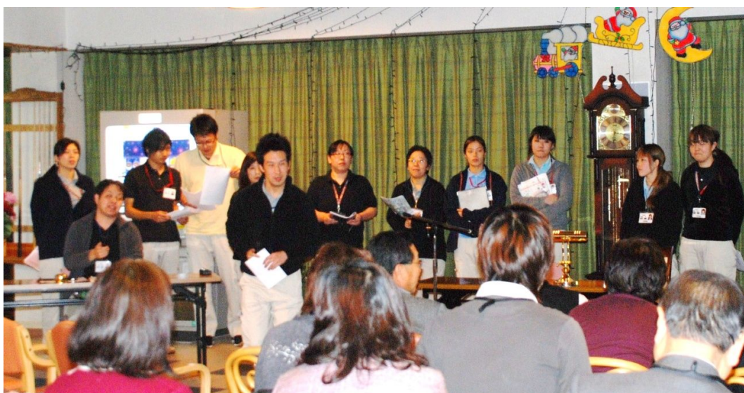
平成21年12月17日「事例発表研修会」の発表風景

入居者のみなさま、ご家族のみなさま、明けましておめでとうございます。昨年はコンサルテ瀬田の運営に関しまして、色々ご指導、ご支援を賜りまして本当に有難うございました。コンサルテ瀬田は本年は元旦の書き初め、二日、三日の建部大社の初詣、そして恒例の三日の大茶会で幕を開けました。毎年元旦に入居者様にご挨拶をさせていただいておりますがお正月の皆様のお顔は輝いておられます。