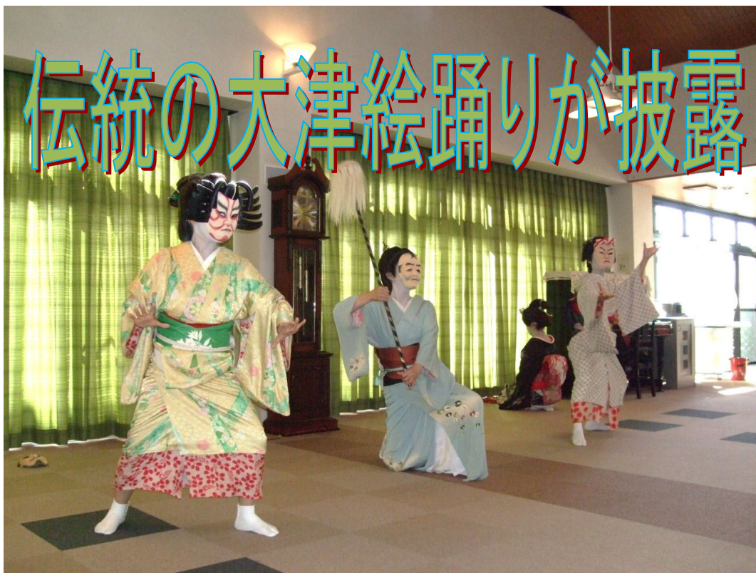
大津絵保存会の皆様による大津絵踊りの舞い(9月20日、さわやかホール)