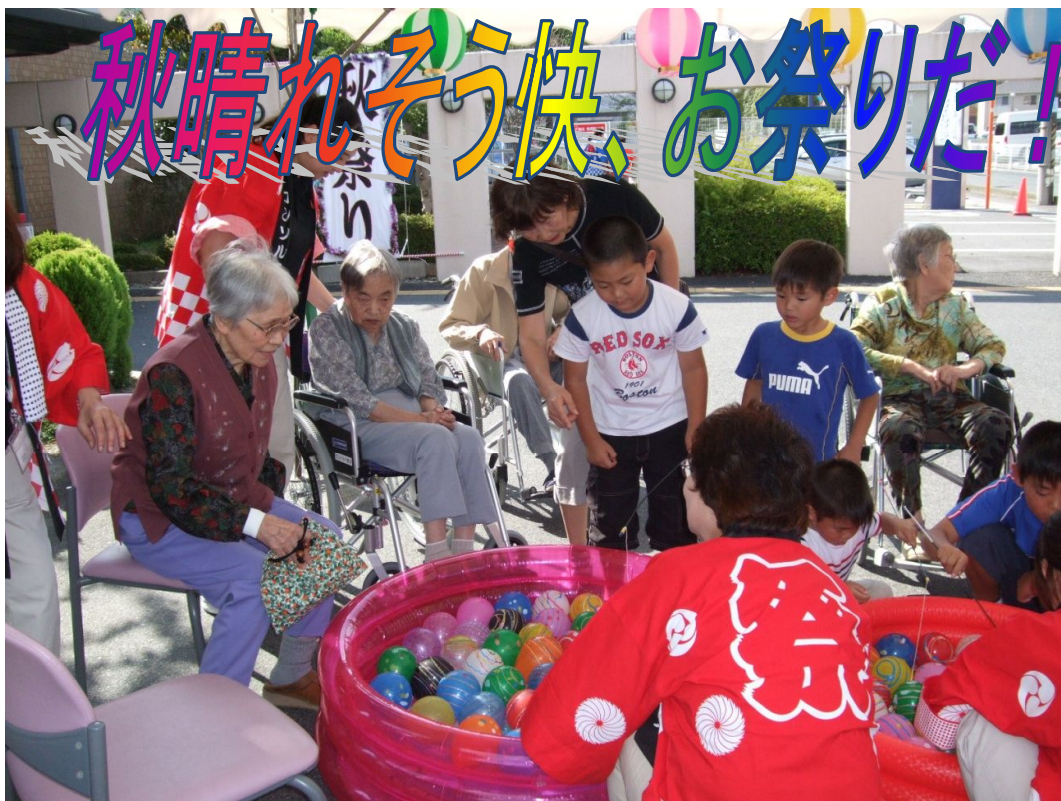
9月26日(土)、好天に恵まれた恒例の秋祭り、子供たちとヨーヨー釣りに挑戦(正面玄関広場)