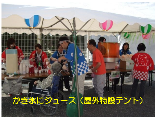
かき氷にジュース(屋外特設テント)

恒例の秋祭りが9月26日(土)に行われました。抜けるようなそう快な秋晴れのもと、ヨーヨー釣り、金魚掬い、射的に輪投げなどのゲームが行われました。かき氷、綿菓子の屋台も出され、ご家族の参加でいっそう盛り上がりました。