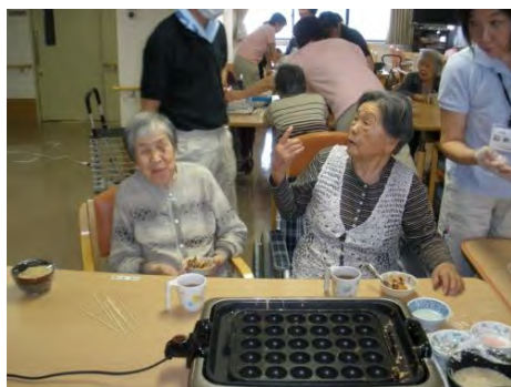
あのっ！用意できてますが

5月18日(月)、3階のお楽しみオヤツは、手作りのタコ焼きでした。本物のタコは、嚙下に障害が心配されますので、竹輪を切って入れましたが、焼きあがった食感は上々で、とても好評でした。なにわともあれ、童心にかえてわいわいと皆さんが楽しい時間を過ごせました。