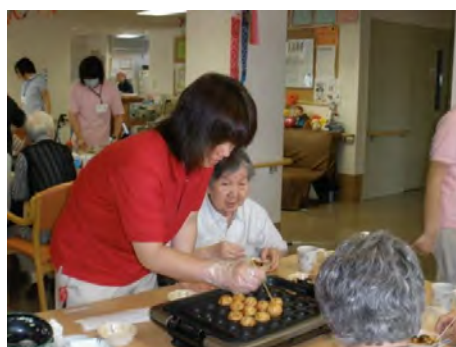
なにしろ、私も初めてでして