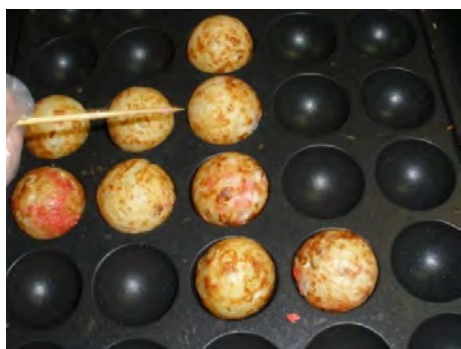
こんがり焼きあがっています！