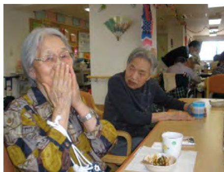
これっ、うまいわっ！！