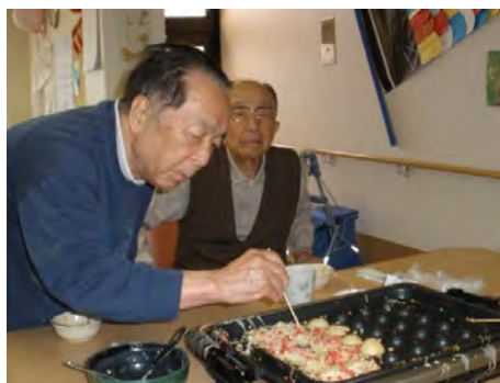
どれ、そろそろかな？