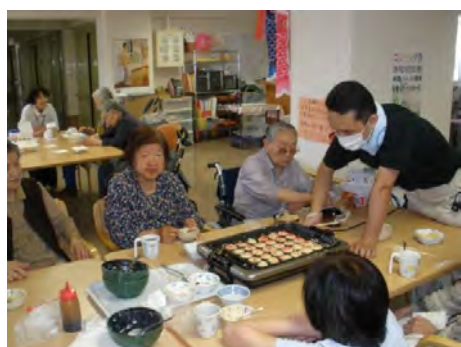
ええっ、焼き具合を見ます。