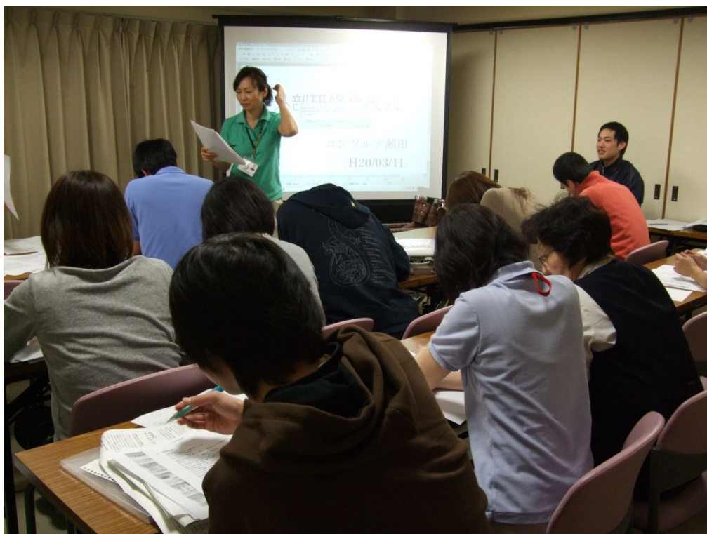
職員の自主的な努力で開催された外部研修報告会、真剣な取り組みで多くの成果をあげている。

報告内容は関係するテーマの基本から始まり、現場での実体験に基づいた解決策の工夫などがあり、参加者は真剣に聞き入っていました。