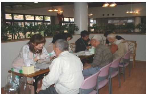
検査会場で、初めての検査にちょっとためらいも