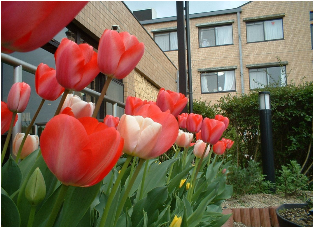
花壇にあふれ咲きほこったチューリップ (いま、花は落ちて茎だけになっていますが、来春にご期待ください。)

園芸クラブの皆さんが、昨年 10 月中旬花壇に植えたチューリップの球根が、4 月中旬みごとに開花し 5 月の始めまで美しく咲きほこっていました。コンサルテ瀬田では現在、多くのサークル活動に積極的に取り組んでいます。園芸サークルもそのうちの一つですが、季節の花を育て観賞する喜びを目標に、花壇の手入れに努力しています。その努力が実りました。花が終れば球根を取り出し、今年の秋まで保存して植え込み、また来春の開花を待つという、地道な活動が行われています。(残念ながら、この便りがお手元に着く頃には花は落ちていますが、また来春を楽しみにお待ちください。)